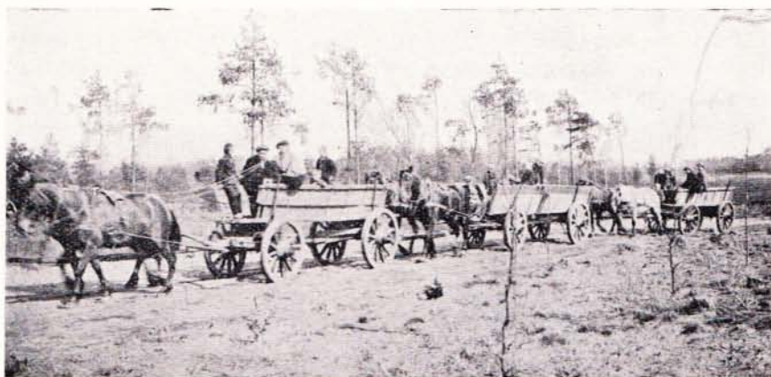
Op weg om het Paashout te halen.

HET VLÖGGELEN is een eeuwenoud gebruik dat alleen in Ootmarsum bekend is. Over de oorsprong van dit eigenaardige gebruik heerst veel ver-