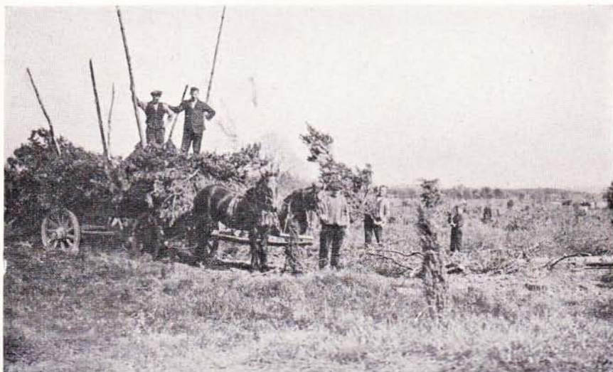
Opladen van Paashout

den blijden toon” en dan telkens en telkens weer het alleluja, alleluja, lang Wanneer men zo de stoet gadeslaat, dan heeft deze toch nog wel iets indrukwekkends zo langzaam en statig als hij trekt, zo ernstig en vol overtuiging als hij zingt de melodie van het „Christus is opgestanden” en het vrolijke „alleluja uitgehaald om de volgende strofe weer wat vlugger in te zetten. Zijn de straten doorkruist, dan komt men allen samen op het marktpleintje voor het stadhuis. Hier trekt de slinger zolang in het rond, dat alle der aangeslotenen daar aanwezig zijn en de keten lost zich op. Nogmaals wordt gezamenlijk het „Christen is opgestanden” en het „Alleluja” gezongen, waarna de kinderen, bij voorkeur door de vaders, hoog worden opgeheven tot drie-, viermaal toe. En hiermede is het „vlöggelen” beëindigd.